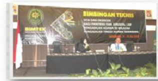
Diklat dan Bimbingan Teknis