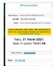
Absen Secara Online